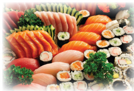
Party Tray A